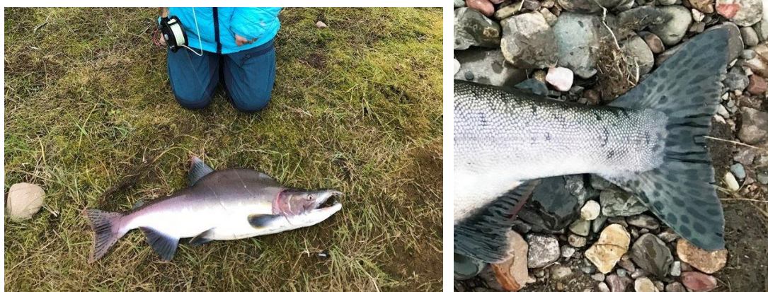
Bilder: Venstre- hannlaks med pukkel, høyre- spord på pukkellaks (her hunn)

Dersom du får pukkellaks: 1) slakt fisken og ta bilde, 2) ta skjellprøve, 3) legg inn fangstrappert samme dag med info om; dato-lengdemål-vekt-redskap-fiskested (elveierlag) – bilde, 4), informer leder / styret, eventuelt SUM så snart som mulig (91535921).